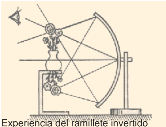
Experiencia del ramillete invertido J. Lacan "Escritos Técnicos de Freud" Sesión del 24 de febrero de 1954

Lo que Lacan privilegia de él es cómo, gracias al espejo cóncavo, se puede producir la ilusión de una unidad que sería el florero con las flores dentro. Eso es lo que el ojo puede mirar como imagen en algún punto central del espejo cóncavo. Es una imagen virtual que solo existe como tal en el reflejo especular.